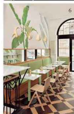
1 et 2. Le salon privé du coloriste vegan Romain Colors. 3. Le bassin d'hiver de Molitor. 4. L'espace pop-up de soins Aesop, sur rendez-vous. 5. Le Spa by Le Tigre, de l'hôtel Monsieur Cadet. 6. Le café veggie Maisie.