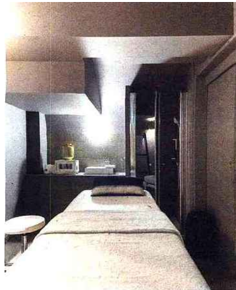
Une cabine de soin du spa by Le Tigre